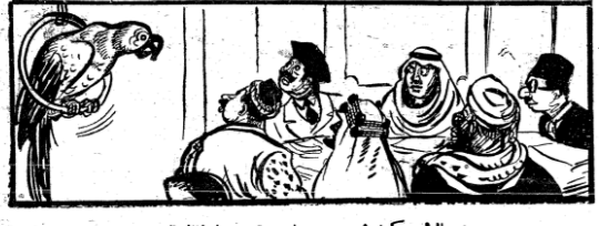
دوره الرئيس كميل سموت بتياج مؤثر وزواء المال العرب البيناه... ابوك السقامات