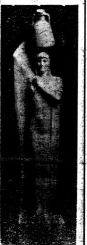
معرض التمثيليات ... !!