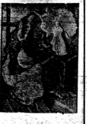
من الشعب ... !!