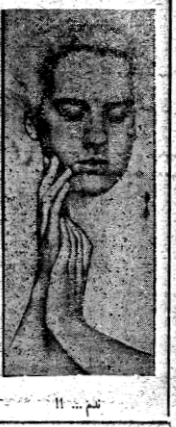
تتم ... !!