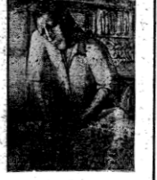
عامل ... !!

معرض الحوادث الفني تقدم الحوادث للوحات التالية من رسم ونحت التي عرضت في المعارض الفنية في مصر في الأسابيع الأخيرة. والفن اليوم هو من أهم العوامل التي تتولد الشعب نحو الحياة والفن هو الذي يمتدح فيه لاهلها الصور الحقيقية الواقعية التي تبين من أجل خدمة الانسان.