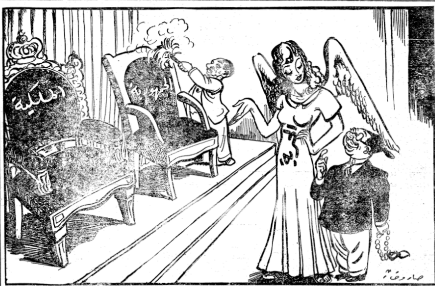
تعلن بصورة رسمية قريبا ارادة الشعب المصري بنوع الحكم في مصر

الامريكية أثناء زيارته الأخيرة لاسرائيل. ومن المتوقع أن تكون هذه الاجوبة قد وصلت الى وزارة الخارجية الأميركية قبل عودة المستر داليس من رحلته الى الشرق الأوسط. ونشرت النيويورك تايمس هذا الاسبوع رسالة بحث بها مراسلها في تل أبيب جاء فيها أن موشه شاريت وزير خارجية اسرائيل قد تحدث من المستر داليس أثناء وجوده في تل أبيب فوصف له القدس بأنها العاصمة التاريخية التي لا بد منها لاسرائيل... وقال ان تعديلاتها ليس فيه ما يفيد أي هدف، فان اسرائيل والمملكة الأردنية لا تريدان التوصل الى المشككة كما ترى بعض فرتيين اسرائيل والاردن من جهة وبين الامم من جهة اخرى. وقد رد المستر داليس بقوله ان الامم المتحدة لم تنسج رأيا في موضوع القدس فمن غير المرجح فيه أن تقبل اسرائيل مكتب وزارة خارجيتها في القدس لأن الولايات المتحدة لا يسكنها نقل فوضيتها من تل أبيب الى القدس. ويقول المراسل أيضاً أن السلطات اليهودية طلبت من المستر داليس مساعدة اسرائيل للحصول على قرض طويل الأجل من الحكومة الاميركية ببلغ ٧٥ مليون دولار لتصفية القروض القصيرة الأجل المتبقية و١١١ مليون دولار تستحق في نهاية آذار القادم. أما الدين المتسحق كان