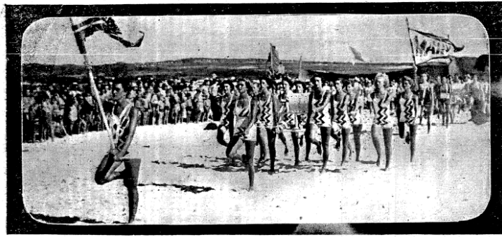
وهن في شوارعها على الشاطئ امام زوار البحر لدعاية لها... ومقدمة موكب العساكر ترى بعض الفتيات يرتدين أحدث - موديل لهاويات اتجهه العام - وتقول الفكرة الاحصائية التي تصورها هذه الفتيات ان مجموع ما بيع من هذا اللابوب حتى الان بلغ نصف مليون وليس من المنتظر ان ينهي فصل الصيف قبل ان يكون المار قد انتهت ثلاثة ملايين مابوب... تصوير 11