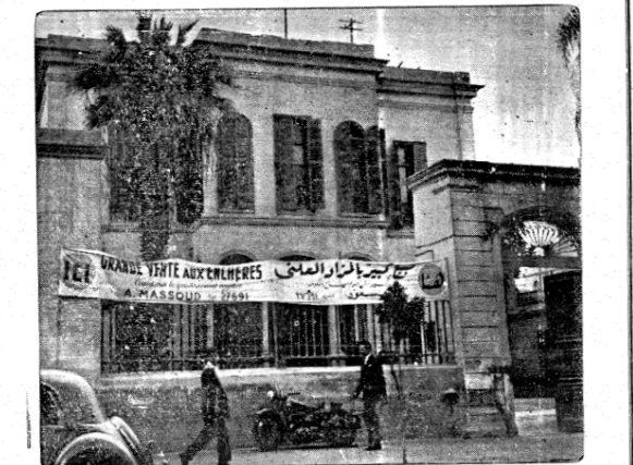
القاهرة - من مراسل الحوادث - من تته بعد مهمة اللجان التي وكل اليها امر اجراء مرادوات بيع عطية على ممتلكات واثاث الاحزاب السياسية المصرية التي حلت في العهد الماضي . وترى في الصورة عمارة الحزب المصري وعليها لافتة للاعلان عن البيع المراد الملني . هذا وليس من المتوقع ان ينتهي بيع جميع ممتلكات الاحزاب واثاثها قبل شهرين آخرين .

انما نظرنا أن تحقق على يد حكومة المهديين . ولا أخال أن وزراء العهد الجديد الذين كانوا صفوف الشعب المطالب بتحقيق أهدافه الى أيام قريه مصتة ، لا أخال هؤلاء الوزراء انهم سيتجاهلون مطالب الشعب ، أوتيتاسون أهداف الأمة التي - كانوا - يبرفونها . تمام المعرفة .