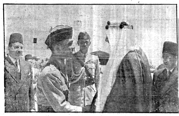
جلاء الملك المعظم يستقبل سمو ضيفه العظيم الامير سعود بن عبد العزيز ولي عهد المملكة العربية السعودية