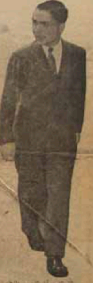
الملك الحسين بن طلال

على كبر الحوادث السياسية يقول: بعدت البلاد اليوم مع الشعب التي تربطها مع القذافي والقذافي تربطها مع القذافي