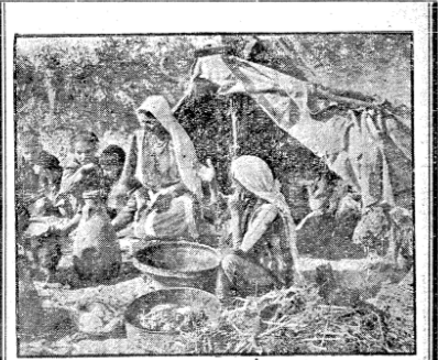
غزة - من مراسل الجواهرات : باشرت السلطات المختصة في توزيع محتويات « قطرات الرحمة » التي وصلت إلى غزة من القطر المصري الشقيق . وقد شكلت اللجان الحكومية لارشاف على عملية التوزيع على اللاجئين .

صان - علمت الجواهرات أن الجهات فلاح رئيس القسم الصحي في وكالة الغوث المتخصصة بحالات الكوليرا المديدة التي تقفها بالاردن وكبار مساعديه وبشت ميهي أمر من اللاجئين بشأن الأحوال الصحية في مخيمهم هذه الشاكي وامكانية ازالة اسبابها . ولعلت الجواهرات أن وكالة الغوث قد وقد استعدت وزارة الصحة الدكتور اعزفت في تقصيرها من الناحية الصحية ،