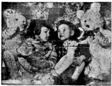
الاطفال يستقبلون عيد الميلاد ويتلقون هدايا « بابا نويل » في رأس السنة . . .

حول التعويضات الالمانية لليهود الفاهرة - وابع - يقول الدكتور على الصافي عضو وفد الجامعة العربية الى ألمانيا الغربية ان هناك من الاسيا بما يمثل الامل في ان تغرب حكومة يونس ماضي الدول العربية وتمتع عن الصديق على اتفاق التعويضات العقود بينا وبين اسرائيل حتى لا تصنف علاقات الضدات القائمة بين الشعب الالمانى والعرب . وطعم أنه اذا فلت اليهود التي قام بها العرب فيجهدون في النابية الى ان