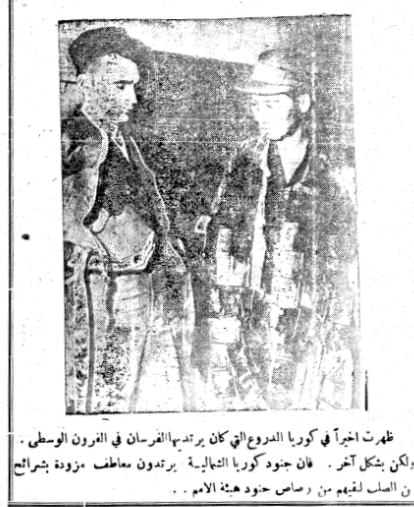
ظهرت اخباراً في كوريا المدعوون التي كان يرتديها الفرسان في القرون الوسطى. ولكن بشكل آخر. فان جنود كوريا الشمالية يرتدون معاطف مزودة بشراولع من الصاب لتقيهم من رصاص جنود هيئة الامم.