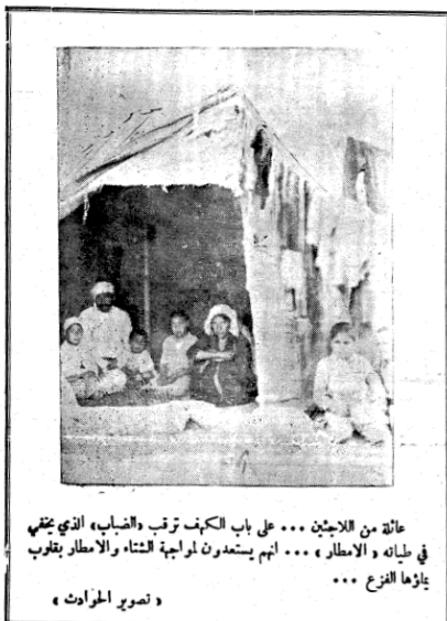
عائلة من اللاجئين ... على باب الكهف قرب والضباب الذي يهبط في طياته والامطار ... امهم يستعدون لمواجهة الشتاء والامطار بقلوب بلاؤها الفزع ...

عمان - طلت الحواادث ان لجنة الغاء القوانين الاستثنائية وتعديل قانون الدفاع البرلمانية الحكومية المشتركة ستجتمع برئاسة السيد سعيد المني نائب رئيس الوزراء ووزير الداخلية في الساعة العاشرة من صباح اليوم . وقد اعدت وزارة الداخلية برنامج اعمال اللجنة يوم امس «الاحد» ومن المتوقع ان تولى اللجنة اجنابها في الاسبوعين القادمين حتى تقدم تقريرا على مجلس النواب .