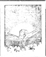
عمل كتابياً في مصرف وقضى الايام

المظ ويقلب حياته رأساً على عقب .. لم يكن « ديبسي » ليهم شيء .. عندما عن صصره اعنانه بمكنه انقام في ركن الرقة جاره انه الجبر والسطورة وورق النقص .. كان اول من جدل الى الصرف اول من غادره .. والتغرب انه .. يطلب أية اجارة طلة هذه للثة وعندما اجازيو واحداً غدا ذلك حديث السكينة طيلة الصباح وأغرق زملاؤه في الضحك عندما عاد الى الصرف عند الظهر يقول انه قضى وقته يتسكع في الشوارع يتسكع في الشوارع في واجبات الناجر وأنه عاد بطلمين في سير العمل .. كان « ديبسي » رجلاً مثالي الجسم كاد لا يلا الفراغ التي اعد له .. ليس