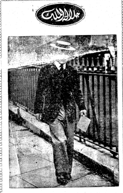
عاد الى الوطن في الاسبوع الماضي ويسافر الى لندن هذا الاسبوع ١

اطلب تلفون ٥٩٩ انما كنت تصلك حالا اغفر الاطعمة والحلويات من « الزهراء » مطعم العاصمة الاول خدمة ليل نهار