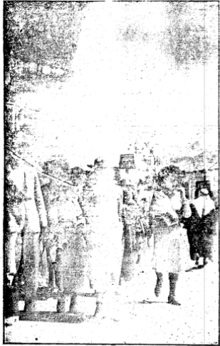
ومن وراء الاسلاك الشائكة « او خطوط المفدنة » يرى سكان القدس « اعداءم » وهم يشجون على ارضهم المقدسة مرحاً... وينعمون في بيوتهم ويمتلكتهم... هؤلاء اعداءهم... يرحسون على ارض الوطن !!!