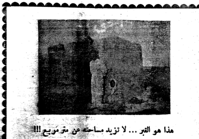
هذا هو القبر ... لا تزيد مساحته عن متر مربع !!!