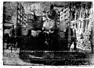
« التاريخ ينفذ نفسه .. لقد كان اجسادنا يمتدون في غذائهم على التمر .. وما نحن اليوم .. ولكن ليس بالمر وحدهم جيا الانسان »