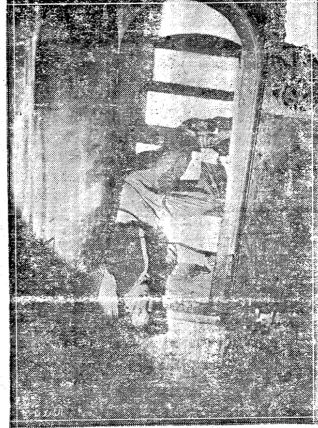
وعلى الدرج... في المكان المقدس، داخل كنيسة القيامة، تضاربت رغبة فتى قزويناً بارتكاب جريمة انتحار في وقت وقوع مفرجاً بدمائه...

القدس - من مندوب الحوادث الخاص - انهى سعادة مدعي عام مدينة القدس التحقيق في حادث انتحار فتى ارامياً شاباً من القدس، وقرر اقفال القضية، واعتبر الحادث انتحاراً عادياً الى هنا وبهذه الكلمات القليلة طويت قصة مؤلمة ليست كثيراً من قصص الانتحار العادية فلم يكن الدافع هو الحب ولا غيره من الدوافع الثانوية التي تدفع بعض الشباب عادة الى الانتحار، وانا هناك واقع قوي دفع هذا الشاب الى الانتحار.. اما لماذا انتحر؟ وكيف انتحر فيه؟ هي القصة: