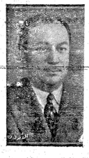
عزمي النشاشيبي في البعد الخامس من عمره يشغل منصب وكيل وزارة الخارجية الاردنية

وزعم بعض رجال الجيش الاميركي ان المدافع الاميركية المضادة لا تتركز في احد تصنع فولاذي مبالغ به حكمة . ولا احد تصنع كورب كانت قابل همهم للمدافع حج في ذبابات ستالين عيار ٢٢ ملمتر . كما تهم كرات الكاتوشوك : « تظفر » ثم تستغل في الارض بين الذبابة توسال زحفها كان ... والذوقية ، والمدافع اقل عدداً لسببها افضل نوعاً ، وشهادة الحامدين ، بينا لدى الروس مدافع اكثر عدداً ، بل ان فرقاً كاملة من الجيش الروسي تستخدم الان مدافع مجرمة الصواريخ الجهنمية واخرى تستخدم فقط القنابل للدمرة العادية .