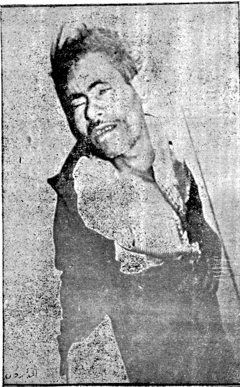
بذل دماغه في سبيل وطنه ... وترك عائلته ليعلمها آباء الوطن ... « تبرعوا لمئات الشهداء القديسين »