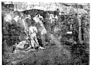
القرى... والمناطق عن العمل... في سوق المخابز القديمة 11

الاجتماعية فكلاهما يعمل ان وجد له شيئا وينام او يتحدث ان لم يجد شيئا يعمل. والفروي يساهم ايضا مساهمة فعالة في وضع مستوى الجلب والفقر والمرض لانه يخضع لنظام بسيط من الناحية الثقافية والصحة وان كان يخضع خضوعاً كاملاً لنظام دفع الضرائب. وهو من الناحية الاقتصادية يوزع ثمنه للمجتمع من خدمات يريدهن في المدن تجردته من الافئدة الذين صنع هذا القول واما في عمان والتي جعلت من ساكنيها طبقة خاصة تتركز الطبقة