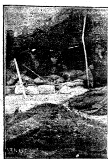
هل لنا صفة خاصة؟

الى تدمر سوارها المكارف على رتبة الابل والشياه ورثة الاماكن التي يتوفر فيها الماء والكلا: وحيداً او قسرت هذه الكتب للناس كيف يعش البدوي حقاً وك يوماً من السنة يعيش. نعم انه يعيش على الابل والقلم والماعز ولكن كما عاش ابناء فحطت قبل مئات السنين. يضي تسعة اشهر ساجناً هائماً على وجهه في الصحاري والبراري يأكل والعرايبه ان توفرت او ما يسمى خبز التارمكتياً طول العام يتوب واحد ولا يخضع لاي رقابة صحية او تقافية اللهم الا لدفع ضريبة تعداد المرابي! واللائحة الاظهر الباقية من السنة وهي اشهر الصيف بعضها البدوي قرب القرى حيث تعيش موشيه بالزروع والابن ما يتوفر لديه من جده وخرف ابل «وحزر» - بمرجل - ثم يشتري له حلا او حلين من الشعر والقلم يعود