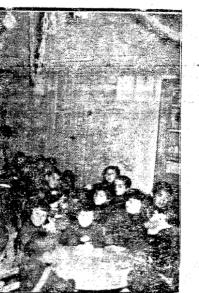
ابناء الامة ... ورجال الله ... يدرسون برياضة دار الطفل العربي . . .