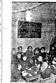
ابناء الامة ... ورجال الله ... يدرسون برياضة دار الطفل العربي . . .

اذا القيت نظرة على البنات والاولاد تشعرون بنشاطهم ، وفرحهم ، وهم مواطنون على الدروس والعمل جبة واجتهاد ، وقد قسمت الامة هند الاطفال الى ست فرق : للتنظيف ، والحياطة ، والعمل والجماعات . . . وفي الدار مشيل للحياطة تتخرج منه الفتيات حائزات على شهادات