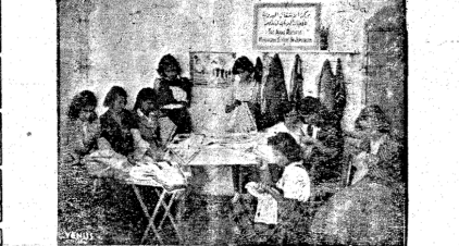
الفتيات الاجئيات . . . ومن يسان يصدت فتحت عين اجابن

الارشاد ، وشرها الافئدة والجطان ، وهي تم في ان يكون اللغاب من حياة البلد ، وتقوم بتوزيع الجطان للموسم والرحلات ، حتى اذا باثرت العاصمات بالشلل وتفتن الضعة حتى تمن من ات يشغل في بيوتهن ، وتقدم العامة للقطعة المنفردة لتقضي فر وسأحسب الاستحقاق اما الاشغال اليدوية فتحتف حتى تقوم الامة آسيا بعرضها للبيع ، وقد ساعدتها الكورونية الاميركية في البيع ، كما انها عرضت الاشغال في دمشق ، واوسات واليبان والى البلاد العربية المختلفة ، وقد قدمت معرضا في عمان ، ورحبت الحكومة الاردنية بهذا المشروع ، وسجعت لها بالنصير . وتقول الامة آسيا ان الغاية الاساسية من المعرض هو ان يرى الرجل