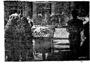
باع « الغداء » السيد ... انه بيع للاخفاء فقط لان الغفراء لا يستطيعون الشراء !!