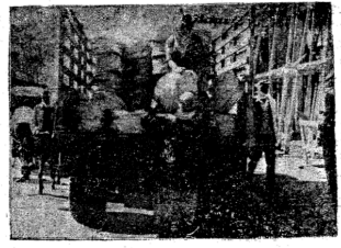
كثر في الآونة الاخيرة استيراد « النسر » من المراق ... هذا هو غداء القفير ...