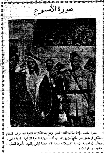
حضر صاحب الجلالة العاهلية الملك المظفر برفعه يده الكريمة بالنية عند عزم السلام الملكي في منزل قصر الحامق من مزرع المري اثناء ازيارة السامية الاخيرة لدينة نابلس . ويظهر في الصورة في مية بجلاسه سادة قائد معطفا نابلس والسيد مأمون القطب ، مندوب «المورات»

عظمة العمد اهم ارضي حقا عيني به ارباب العول ، ولا تزني عقلا احدهم به ارباب الحفظ على ابن ان طالب