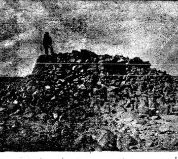
صورة مدونة «ها بن عرب بن ها بن ج»

قال مندوب الحوادث الخاص: ذهبت الى المتحف، ولأقبال المستر هارونغ مديره، ومعي الاثار في المتلكة استوضح بعض المعلومات عن الاكتشاف الاثري الذي قامت به مصلحة الاثار والذي اشارت اليه «الحوادث» في العدد الماضي. قال المستر هارونغ عندما قابلته: ان ما نشرتموه في العدد الماضي صحيح الى حد بعيد، لكن الموقع ليس بالقرب من الخفرو، وانا بالقرب من «جذاف» والذي اشارت اليه «الحوادث» في العدد الماضي. قال المستر هارونغ عندما قابلته: ان ما نشرتموه في العدد الماضي صحيح الى حد بعيد، لكن الموقع ليس بالقرب من الخفرو، وانا بالقرب من «جذاف» والذي اشارت اليه «الحوادث» في العدد الماضي. ١- هل القانون للوقت رقم ١٩-٥١ مخالف للدستور أم لا؟ ٢- فاذا كان مخالفاً للدستور هل يجوز للمحاكم ان تبحث في دستوريته أم لا؟ «البيعة على ص ٦»