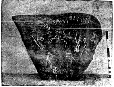
المركبة الحربية التي صورها فريق من حائط المنين ...