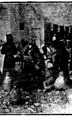
هنا ياردون الماء ... و اليونان التي تساق غيث السماء ...

ان هناك حوالي ( ٣٠٠٠ ) طفل بين ذكر و انثى يتلقون التعليم او ما يشبهه التعليم في تخيم الكرامة و يتوزعون على ١٨ مدرسة . و منهم ( ١٩ ) معلمة و ( ٥ ) معلمة . و هذه حارول المسؤولين اذخالات التعليم المهني فانشارا ثلاث مدارس صناعية يشغل فيها الصناعون .