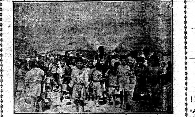
البراعم الصغراء... من أطفال اللاجئين في غير الكرامة... من غفر هذه البراعم وتتم بشمن الحرة فوق وتزهر ؟! « اقرأ التامل في صفحة ٣ »