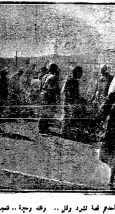
ويون هولاء .. لا يدك ان تسع من احد فمة ثرد و رن .. و لده حرجة .. فحبيب من تحمل هذا الصب لكر منه المني !

و يوزع مركز الخسماة الاجاعية تسعة آلاف و حدة حليب يوميا على الاطفال الذين تراوح امصارهم ما بين صفر و خمس عشرة سنة . و حسب التقدير الرسمي يقال بان هناك خمسمائة طفل سامت احوالهم بسبب سوء التغذية . فلا ادري كيف اوقف بين ما قاله عن الرعاية المبدولة و الزوس البادي على هذه البراعم الصفراء ذات الاقدام العارية و الزروس الحائرة و الالبسة الملهية . متى تخفف هذه البراعم و تنعم بسبس الحرفة تورق و تزهر و الى واحد .